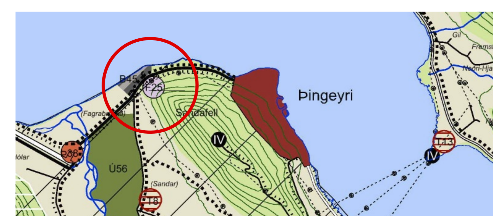
Úr Aðalskipulagi Ísafjarðar 2008-2020 - Mkv. 1:25000