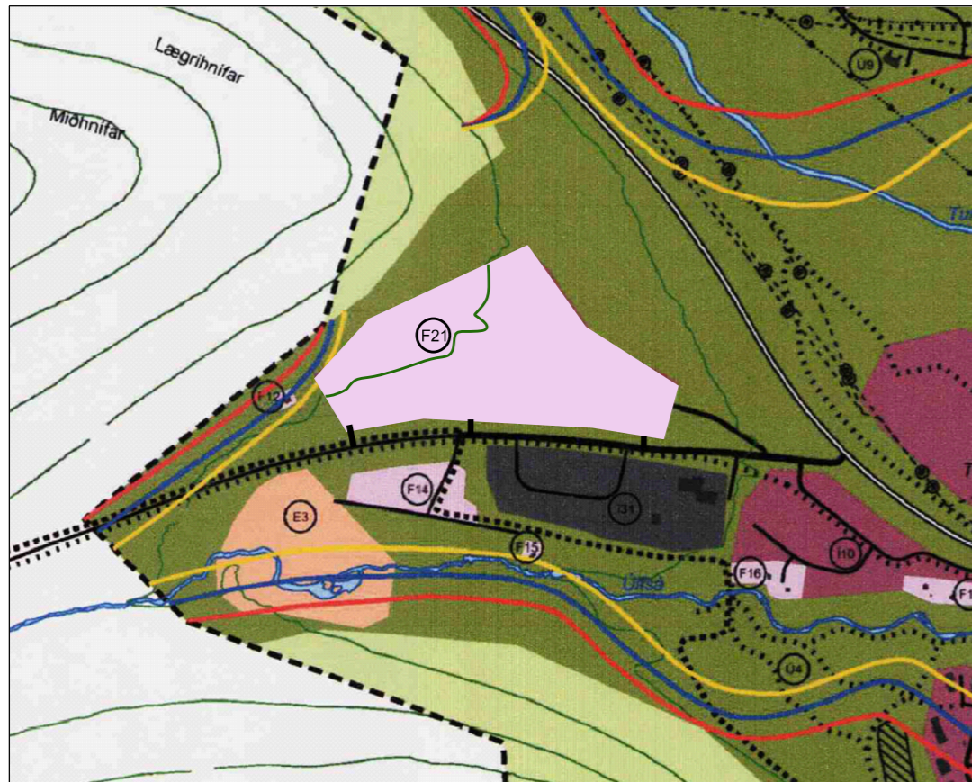
Þéttbýlisupprátturinn eftir breytingu mkv. 1:10.000