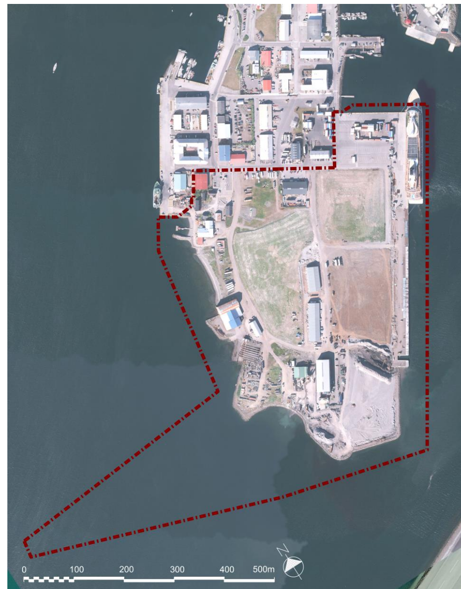
Mynd 1 Afmörkun svæðis sem aðalskipulagsbreytingin tekur til.

Skipulagsbreytingin felur ekki í sér framkvæmdir sem eru tilkynningarskyldar eða matsskyldar skv. lögum um umhverfismat framkvæmda og áætlana nr. 111/2021. Fjallað er um umhverfismat aðalskipulagsins í kafla 4.