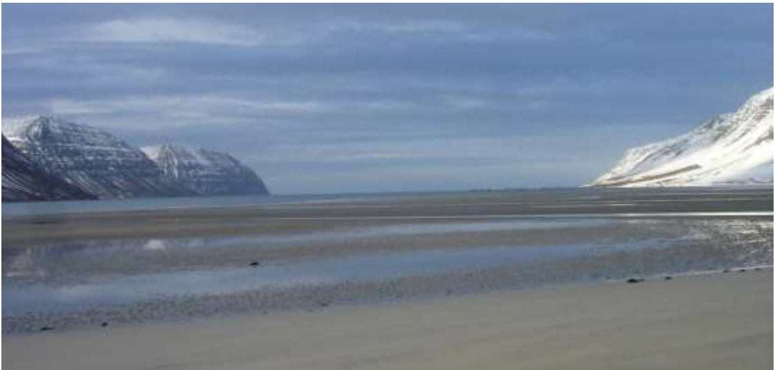
Holtssandur og Öundurarfjörður

Til frekari upplýsinga er vísað í greinargerð í fylgiblaði Flateyri.