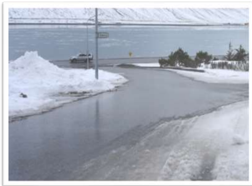
Vallartún séð af Miðtúni að Skutulsfjarðarbraut.