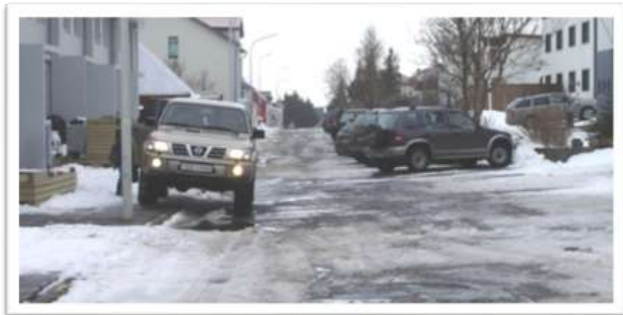
Hlíðarvegur séð frá eystri enda vegar. Mjög slæmar bifreiðastöður.