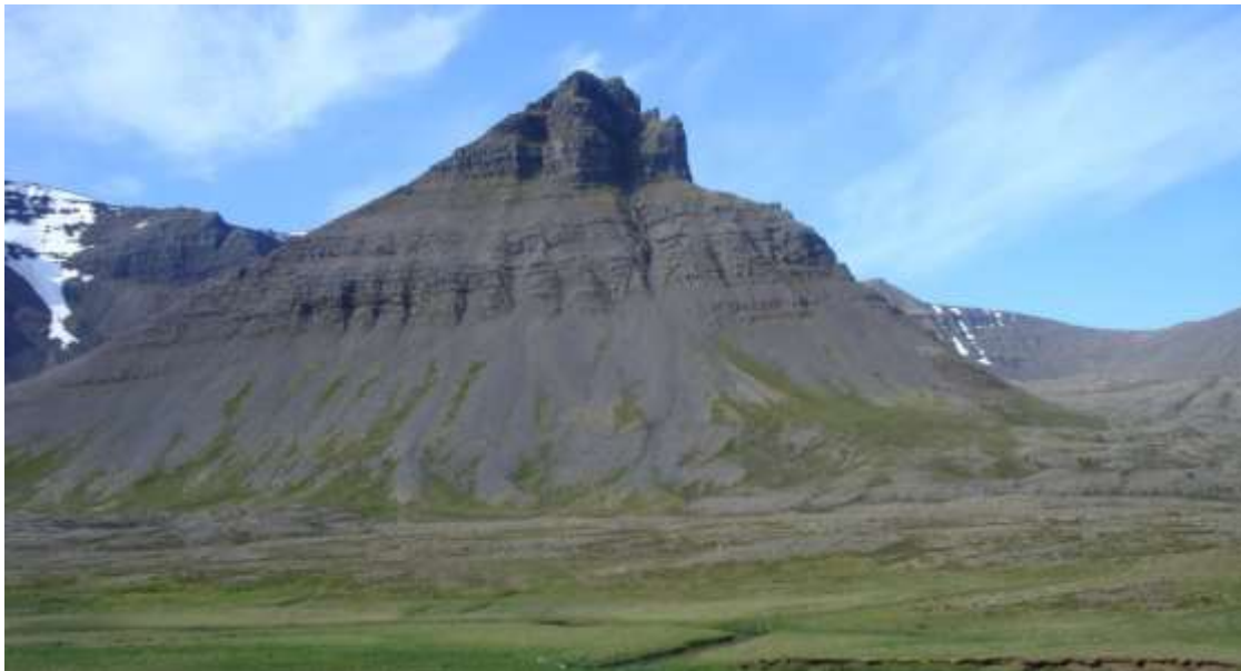
Frá Dýrafirði. Hundshorn í Keldudal

Til frekari upplýsinga er vísað í greinargerðina í fylgiblaði fyrir Þingeyri.