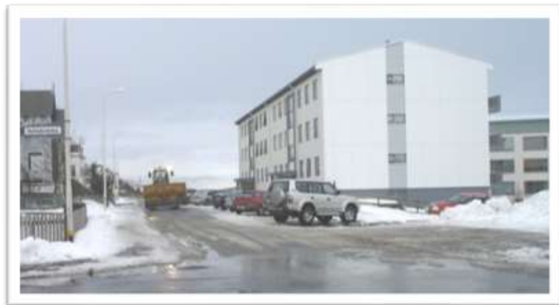
Myndir sýnir hvað akandi umferð er aðþrengd við Túngötu 18 og 20.