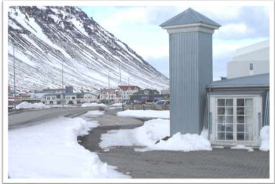
Pollgata séð til austurs frá bifreiðastæði við Edinborgarhúsið.