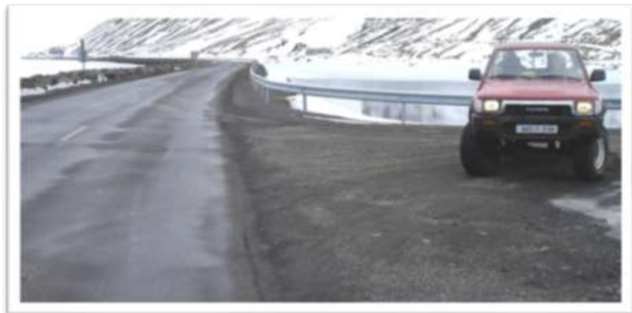
Súgandafjarðarvegur - Sætún