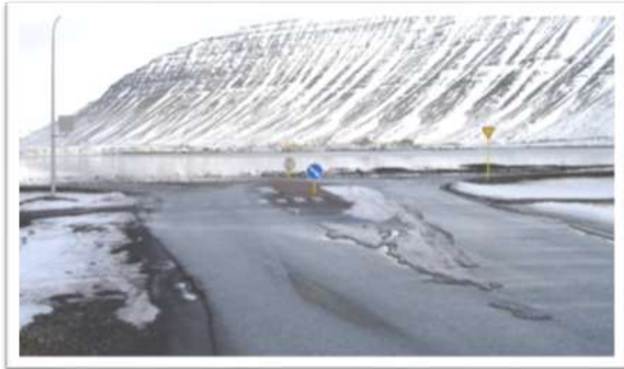
Djúpvegur séður af Tungubraut.