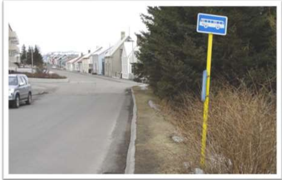
Strætisvagnabiðstöðin við Seljalandsveg 4 í góðu veðri.