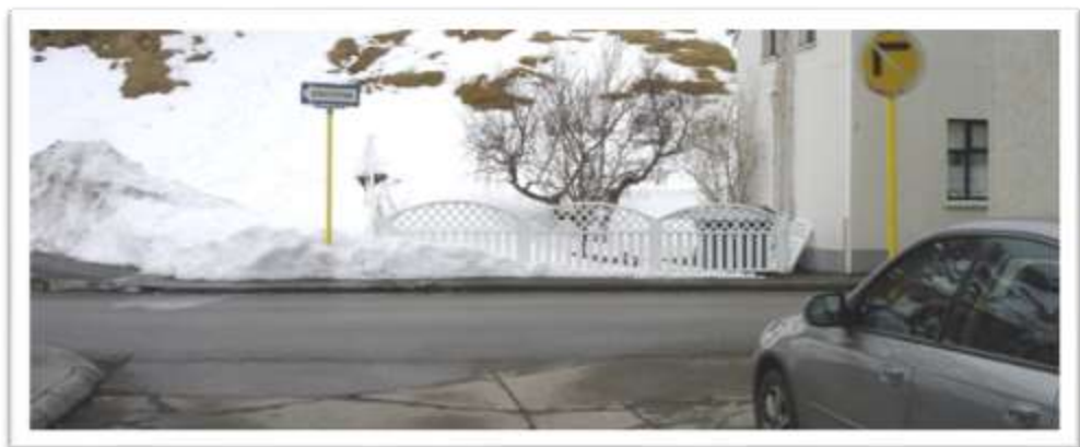
Skipagata séð að Aðalgötu