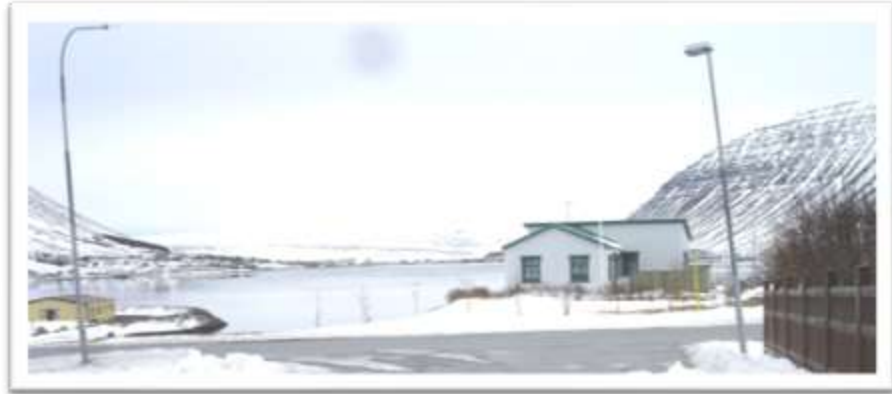
Árholt í átt að Djúpvegi. Biðskyldumerkið sést ekki.