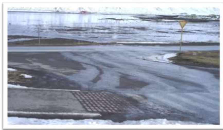
Djúpvegur séð af Skógarbraut efri. Akstursleið illa skilgreind.