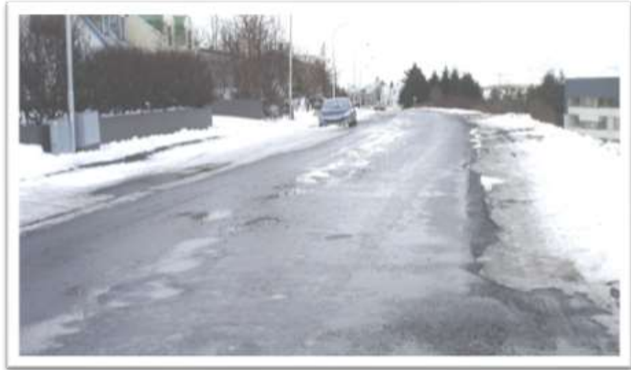
Seljalandsvegur séð frá húsi númer 24.

Það eru tvær biðstöðvar strætisvagna við Seljalandsveg til móts við hús nr. 4 og 24. Mjög slæm aðstaða er fyrir farþega að bíða eftir vagninum. Koma þarf upp aðstöðu, skýli, á báðum stöðunum. Mála gangbraut þvert á Seljalandsveg við biðstöðvarnar og setja gangbrautarkerki D02.11 beggja vegna gangbrautanna.