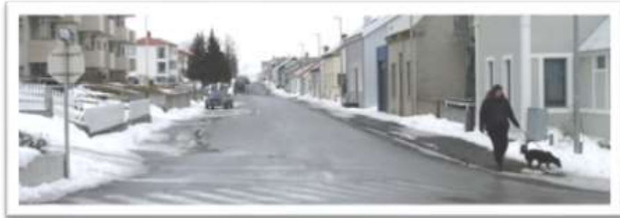
Hlíðarvegur séð frá Seljalandsvegi.