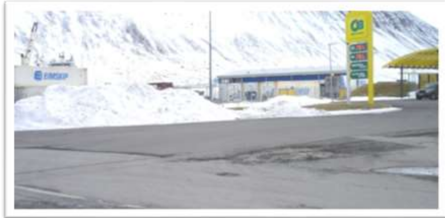
Gatnamót Sindragötu og Njarðarsunds ásamt aðkomu að bensínstöðinni.