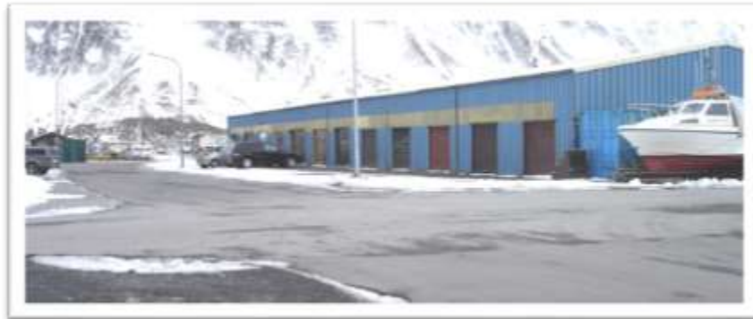
Gatnamót Sindragötu og Mjósunds.