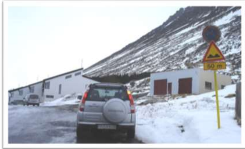
Umferðarmerkið holóttur eða ósléttur vegur. Rangar upplýsingar.