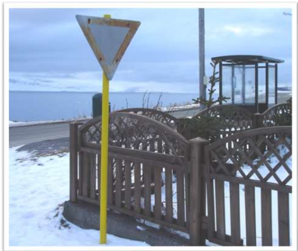
Heiðarbraut til austurs, séð yfir Ísafjarðarveg. Illa farið umferðarskilti.