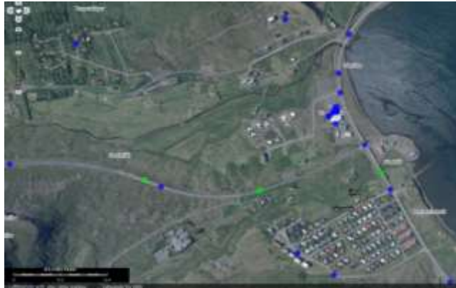
Holta- og Tunguhverfi ásamt Tungudal