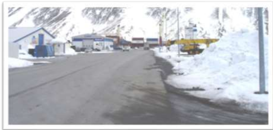
Ásgeirsgata séð frá Suðurgötu út á hafnarsvæðið til suðurs.