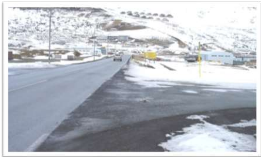
Djúpvegur heimreið að Brautarholti.