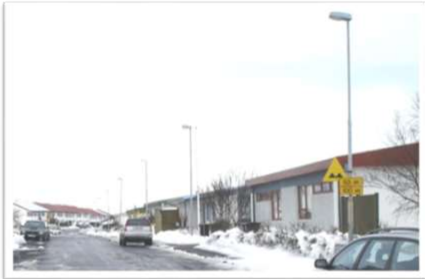
Rangar merkingar á Urðarvegi. Ósmekklegr uppsetning merkjanna.