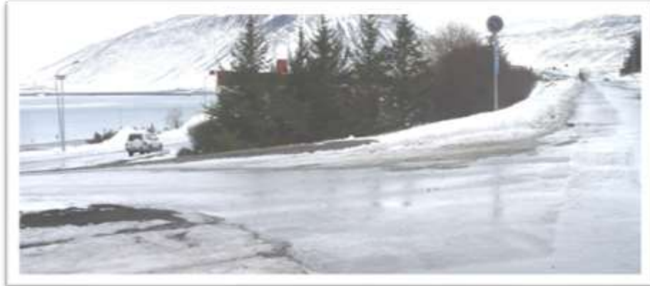
Gatnamót Miðtúns og Seljalandsvegs. "Mjög opin" og án umferðarmerkja.