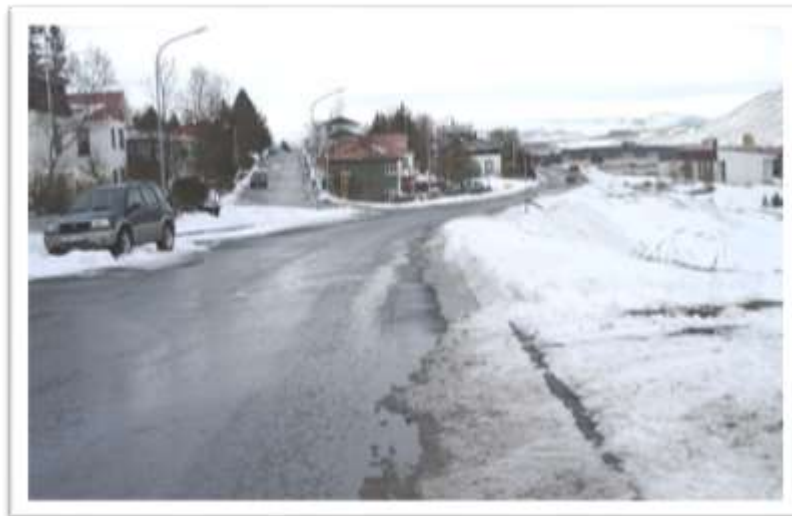
Seljalandsvegur séð frá Miðtúni.