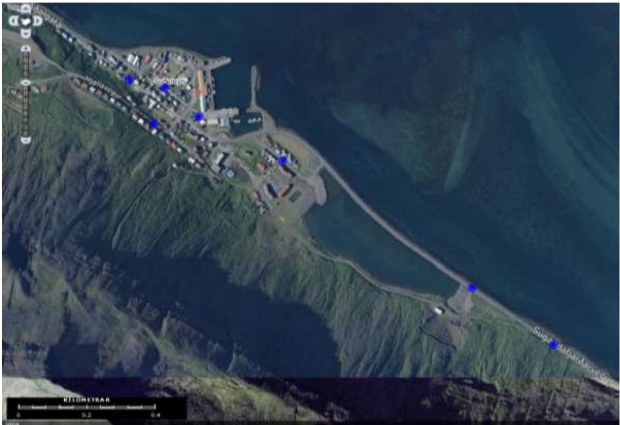
Suðureyri við Súgandafjörð

Íbúafjöldi á Suðureyri (póstn. 430) þann 01. janúar 2013 var 281. (Hagstofa Íslands 12.02.13).