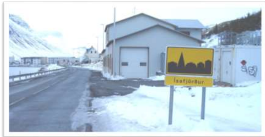
Hnífsdalsvegur 27 og gangvegur sunnan við húsið.