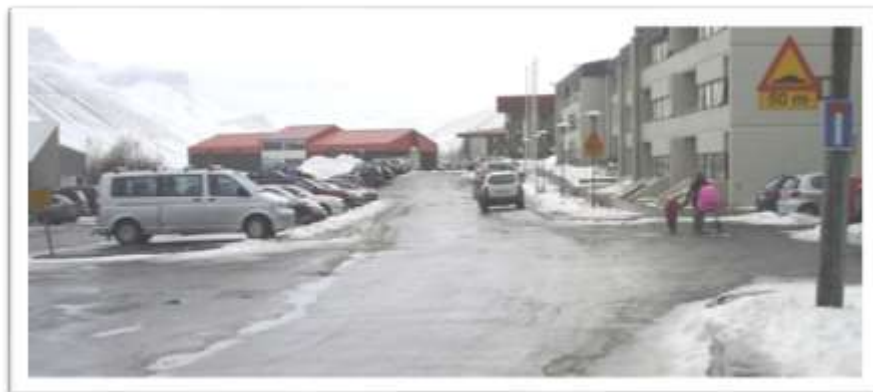
Torfnæs séð að til vesturs.