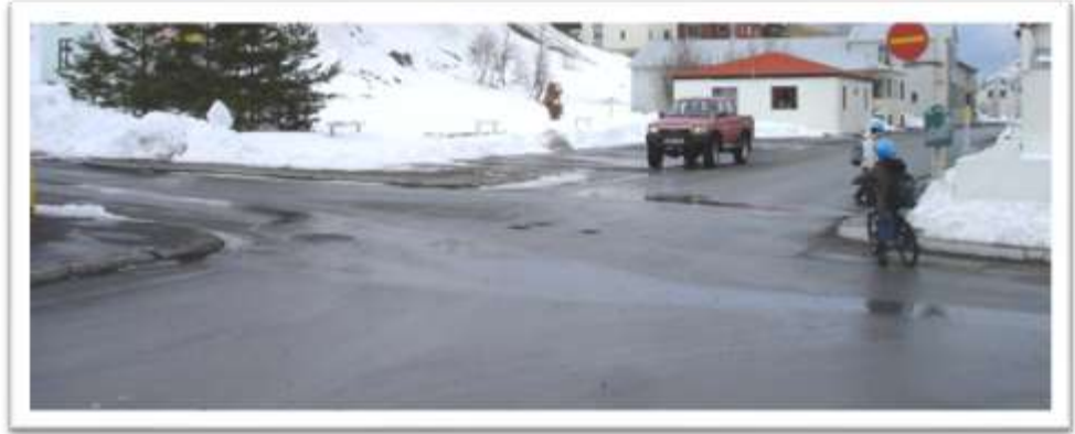
Aðalgata – Freyjugata – Túngata