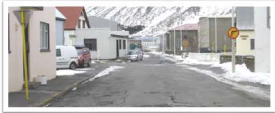
Austurvegur séð til norðurs frá Tangagötu.