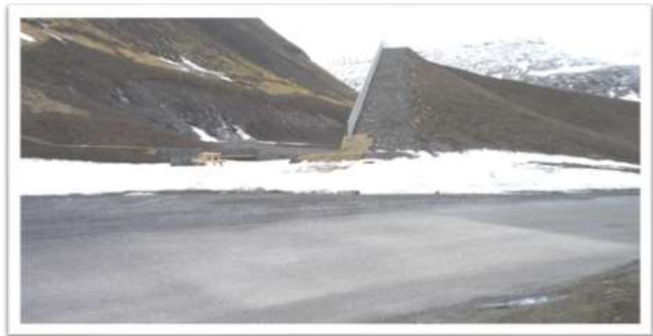
Gatnamót Holtabrautar og Stórhólts. Varnargarðurinn

13001 A Í beygjuna Holtabraut – Stórholt vantar stefnuörvar K20.11 . Þessar örvar voru á gatnamótunum í upphafi, en smám saman hafa þær skemmst og fóru staurarnir endanlega þegar varnargarðurinn var byggður. Þarna hafa orðið nokkur óhöpp eftir að örvarnar fóru. Á veturna þyrfti að setja framlengingar á staurana svo þeir standi upp úr snjónum.