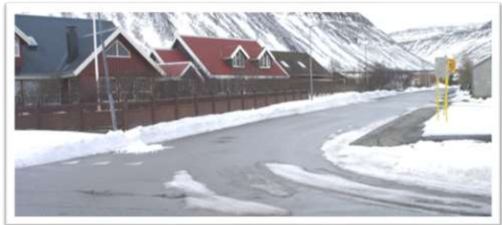
Árholt séð frá Djúpvegi. Kort af Holtahverfi og umferðarmerki að baki þess.