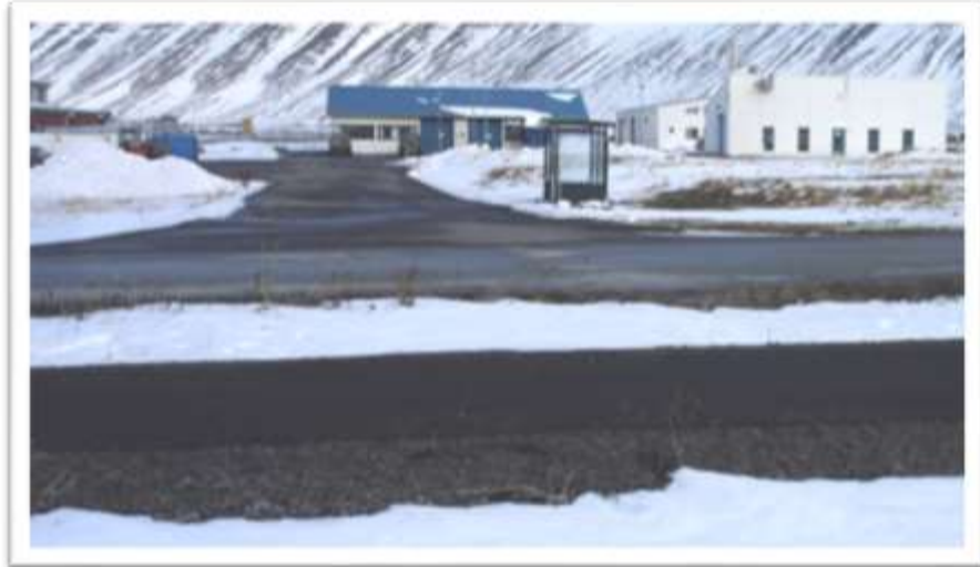
B-gata séð yfir Tungubraut að biðskýli strætisvagna. Gangstígur í forgrunni.