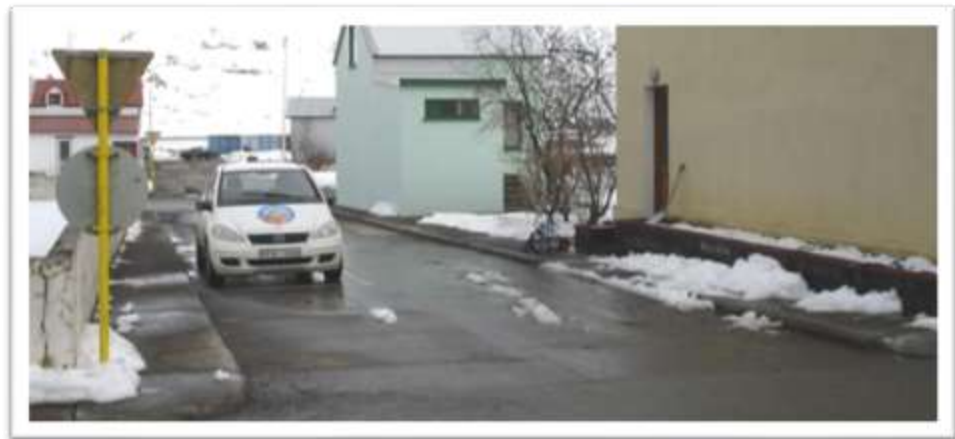
Skólagata séð til suðurs frá Aðalgötu