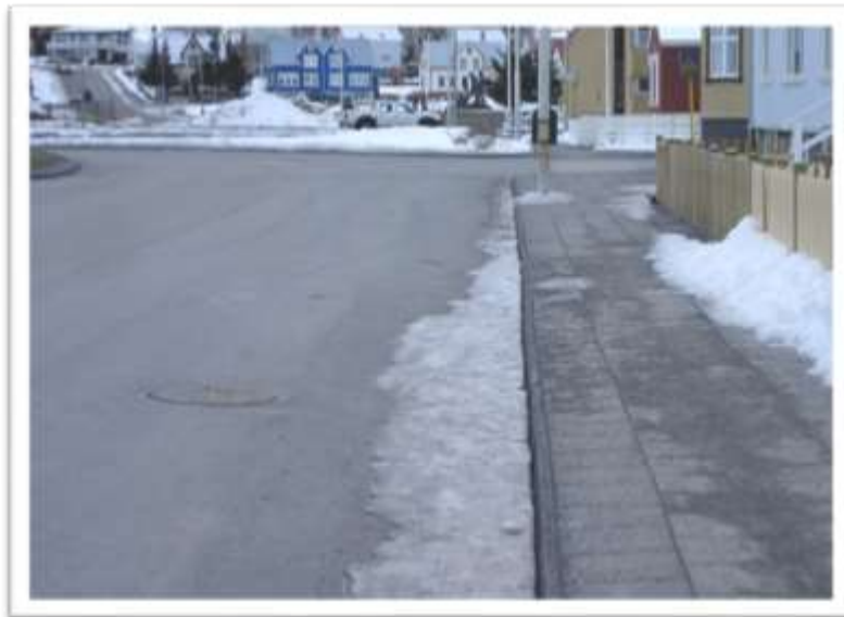
Hafnarstræti séð til norðurs frá Mánagötu að Hrannargötu.