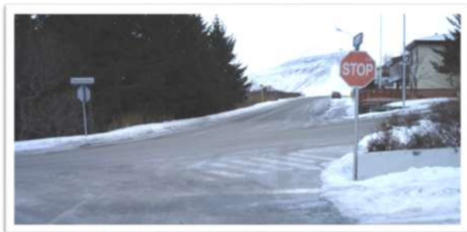
Seljalandsvegur, Urðavegur, Bæjarbrekka séð af Hlíðarvegi.