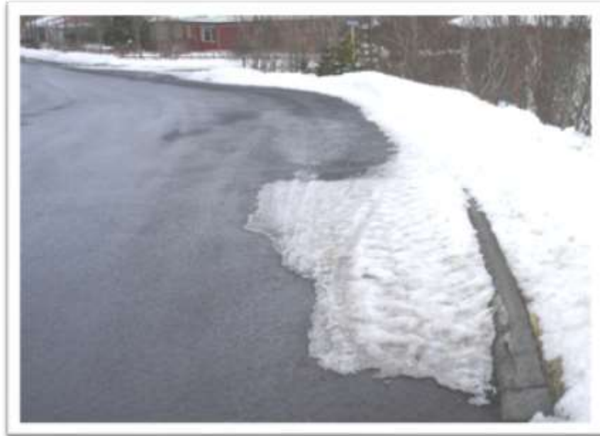
Beygjan á Stórholti frá Holtabraut að Kjarrholti.