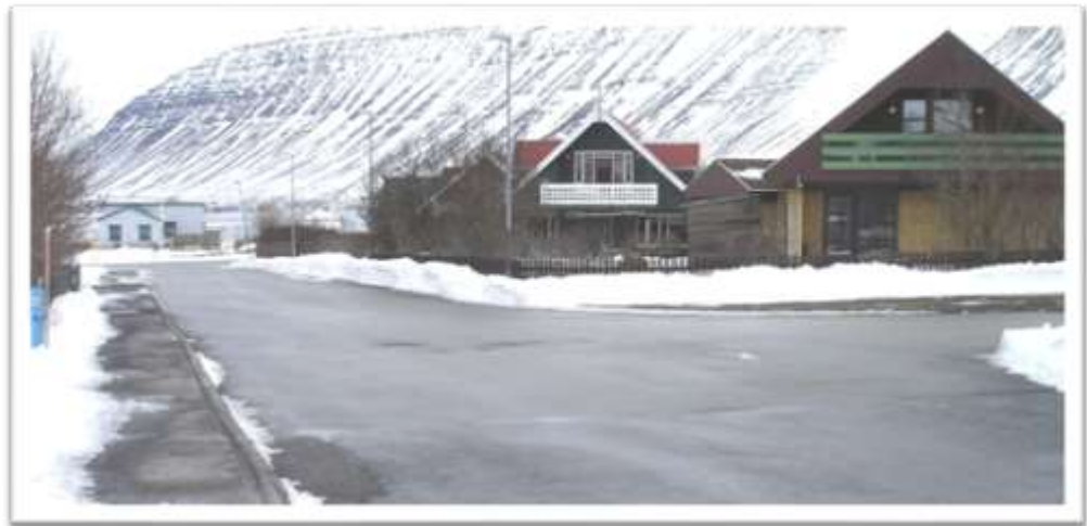
Gatnamót Árholt og Hafrahólts. Lega gangbrautarinnar.