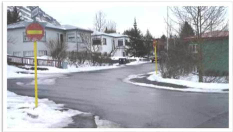
Gatnamót Engjavegs og Seljalandsvegs.