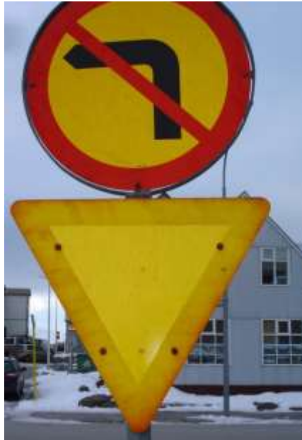
Gatnamót Hafnarstrætis og Mánagötu.