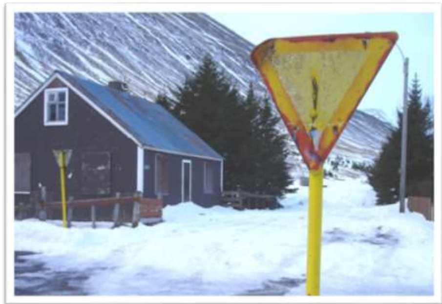
Heiðarbraut til vesturs, yfir Garðaveg.