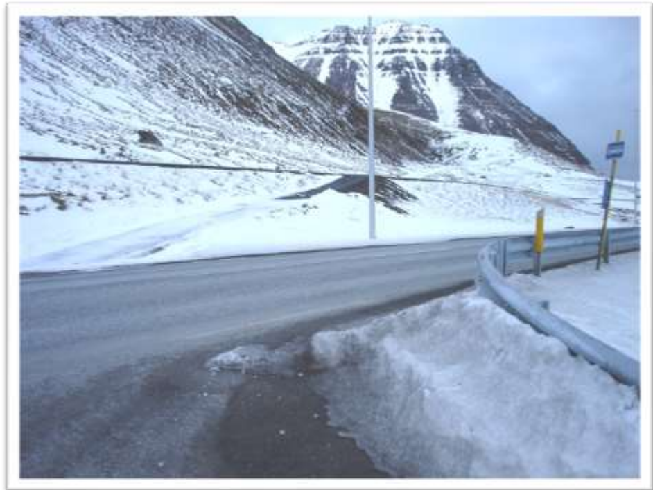
Djúpvegur heimkeyrsla að Hraðfrystihúsinu í Hnífsdal – endi gangstígs - biðstöð strætisvagna (H1316)