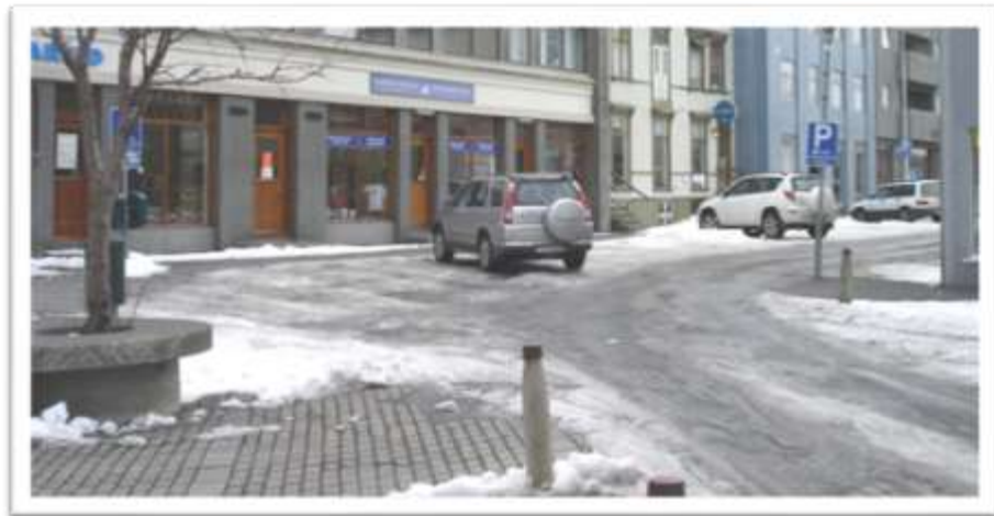
Gatnamót Hafnarstrætis og Aðalstrætis. Þrengingin í beygjuni.