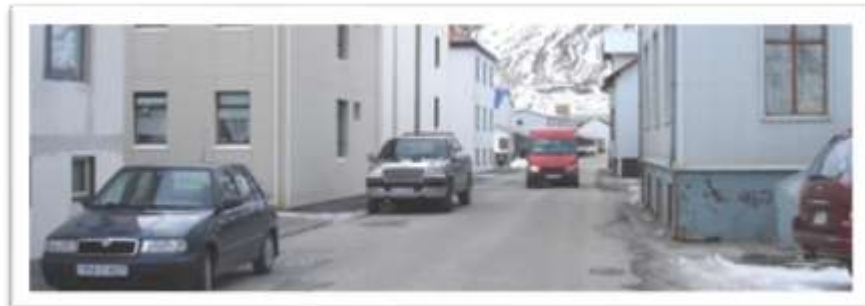
Fjarðarstræti. Þrenging við hús númer 14 og 18.