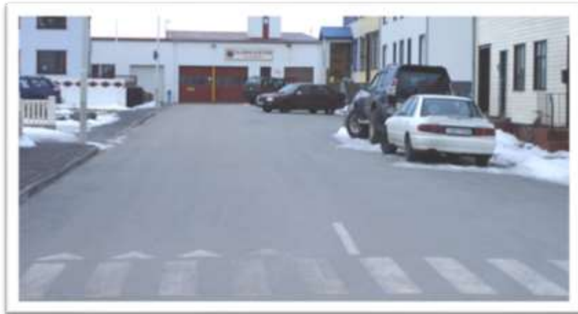
Pólgata séð til austurs. Bifreiðum mjög illa lagt og B21.11. sést vinstra megin.