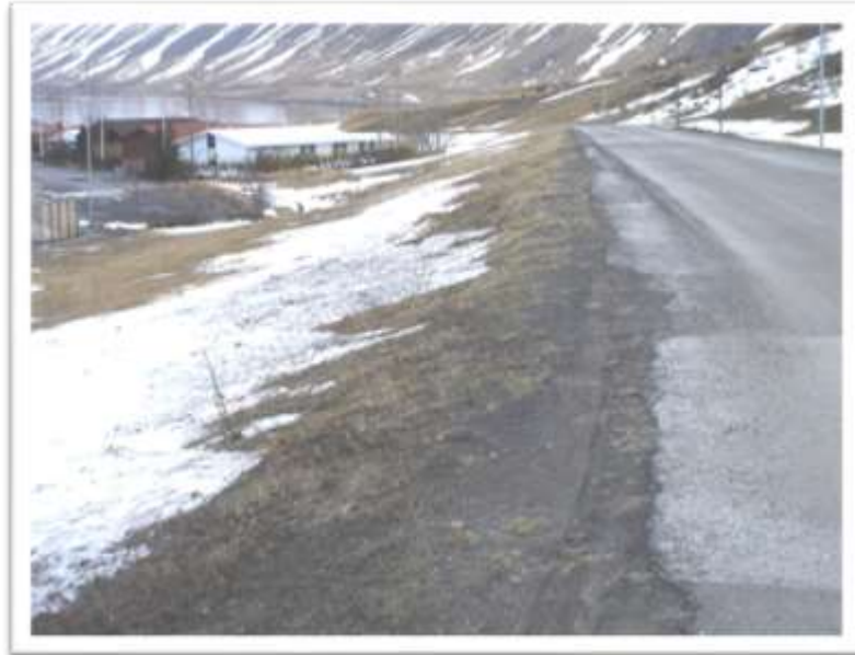
Holtabraut til austurs og svæði það sem lagt er til að gangstígurinn komi.