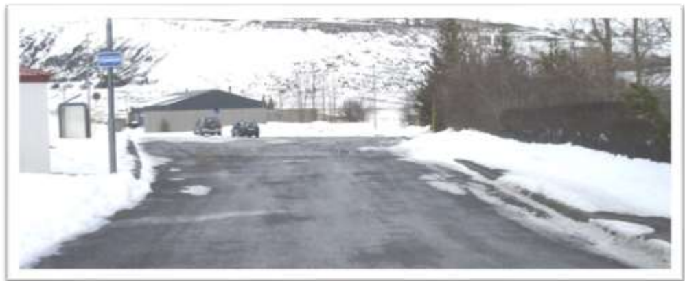
Norðurendi Stórholtis. Úrtak á gangstétt og rangar umferðarmerkingar sjást á myndinni.