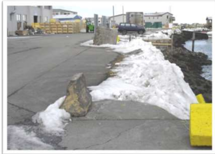
Hafnarkanturinn séður til austurs þar sem gönguleiðin er lögð til.