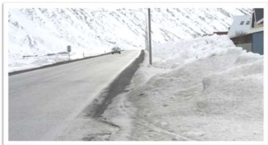
Djúpvegur séður til suðurs frá Árholti. Tillaga um legu gangstígs.